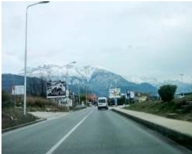
Slika br.2.1-Magistrala uz koju se postavlja kabl