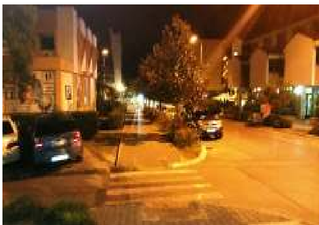
Slika br.2.5-Mjesto realizacije u centru Tivta