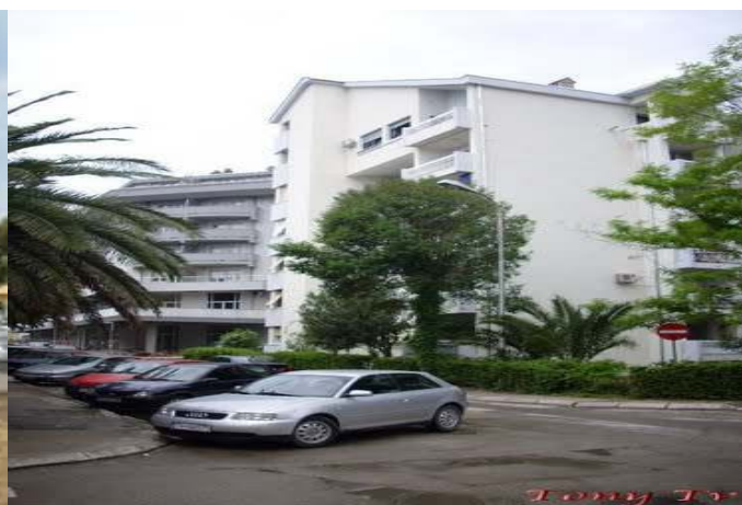
Slika br.2.4-Mjesto izvođenja radova u Tivtu