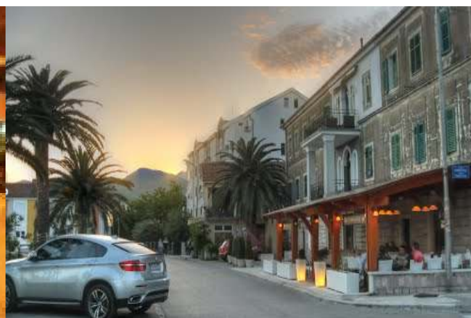
Slika br.2.6-Mjesto izvođenja radova u Seljanovo