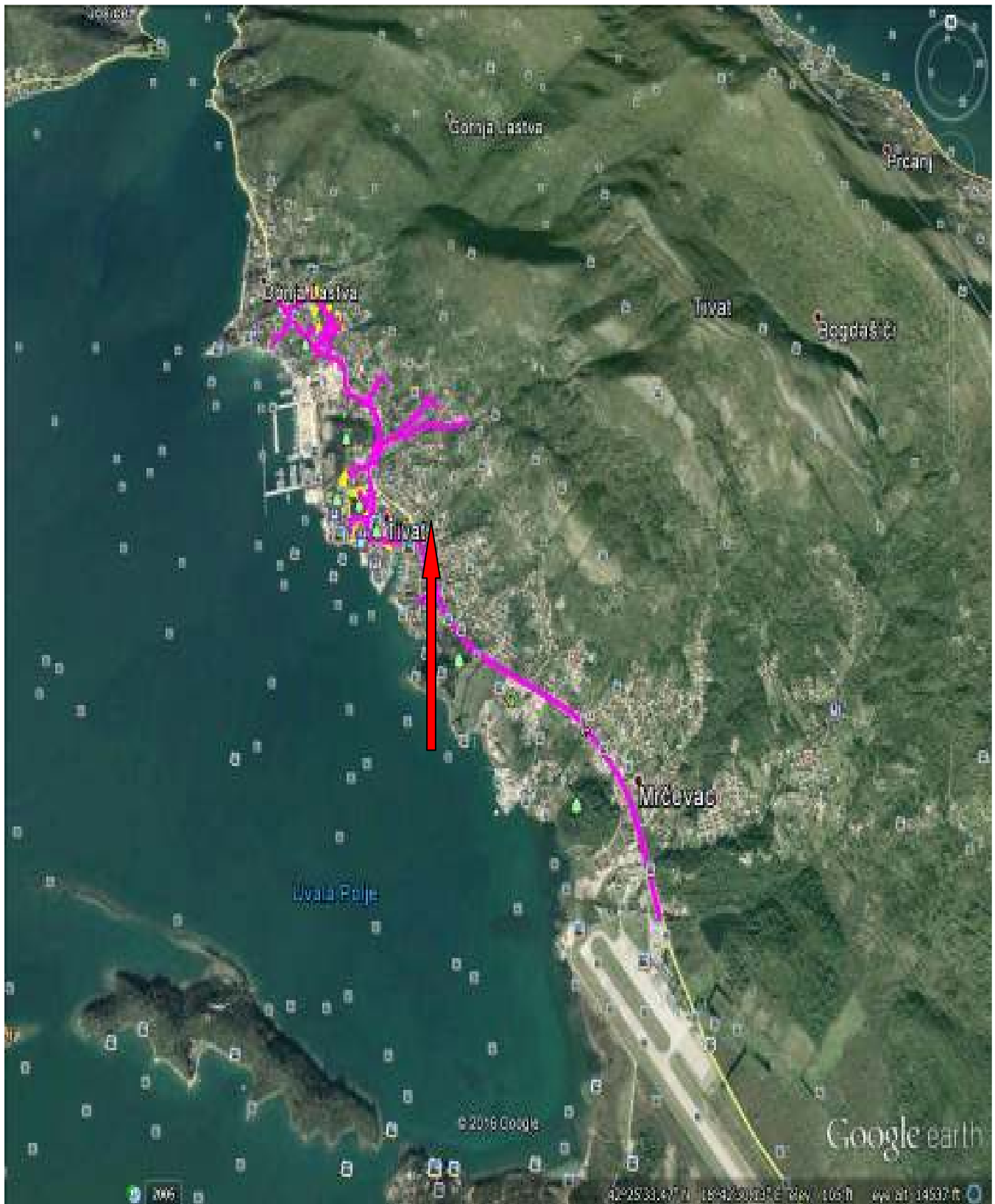
Slika br.2.7-Satelitski prikaz lokacije izvođenja kablovsko-distributivnog sistema