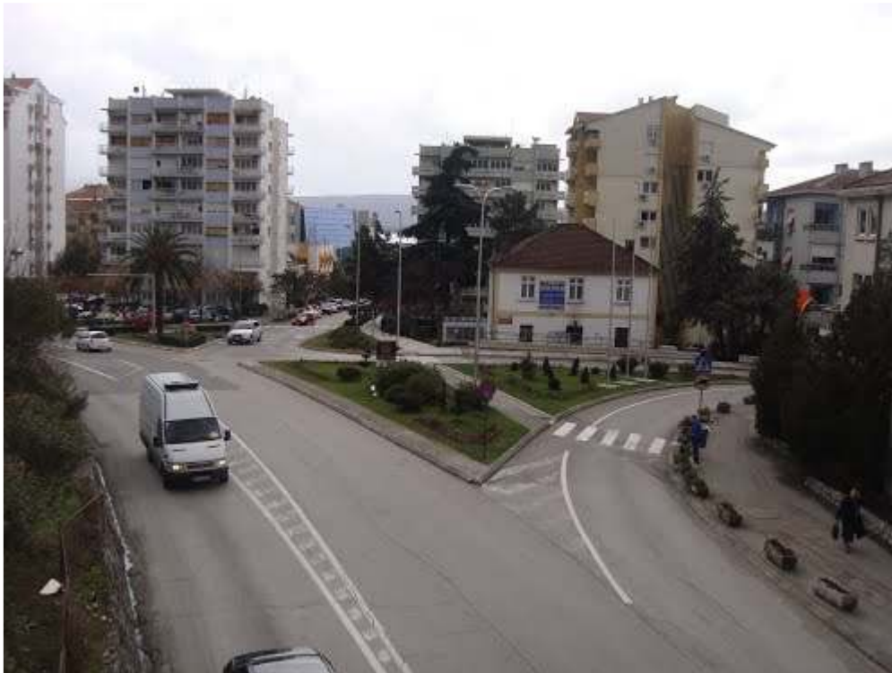
Slika br.2.7-Detalj sa predmetnog područja

Takođe, na ovoj lokaciji ne postoje objekti koji treba da se zadrže kao revitalizovano naslijeđe istorijske, industrijske ili druge arhitekture. Sama lokacija trase ne predstavlja značajan i prepoznatljiv prostor u odnosu na okruženje.