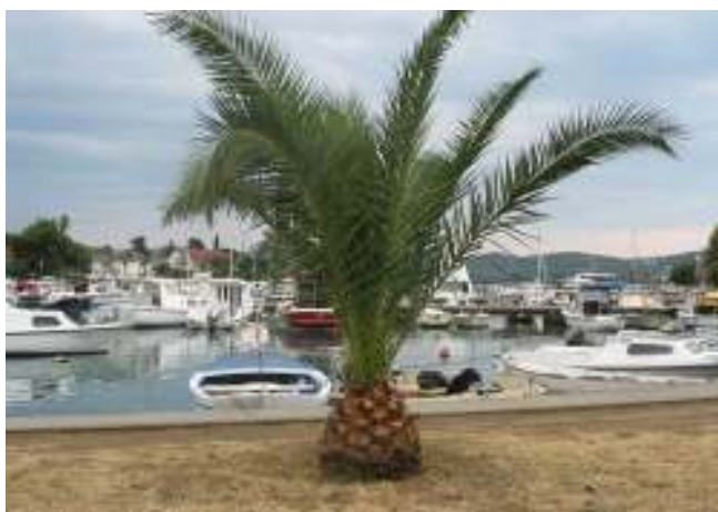
Slika br.2.3-Područje u naselju „Kalimanj”