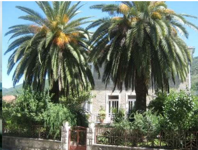
Slika br.2.2-Jedan od objekata u blizini trase