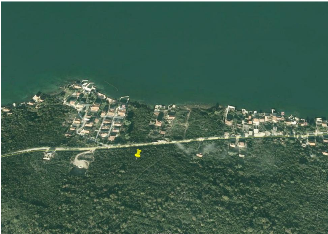
Slika 1. Satelitski snimak lokacije projekta

Izrada tehničke dokumentacije za izgradnju turističkog kompleksa je u skladu sa Urbanističko tehničkim uslovima dobijenim od Sekretarijata za uređenje prostora i zaštitu životne sredine opštine Tivat.