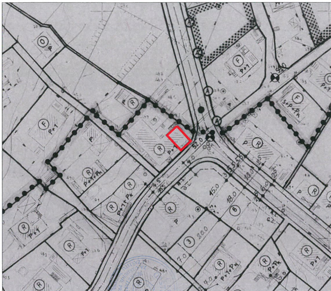
Sa lista: Regulaciono nivelacioni plan, R 1 : 1000