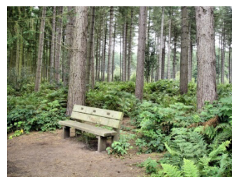
primjeri uređenja park šume

Izvod iz Prostorno urbanističkog plana Opštine Tivat do 2020. (7.1.1 Plan uređenja zelenih površina)