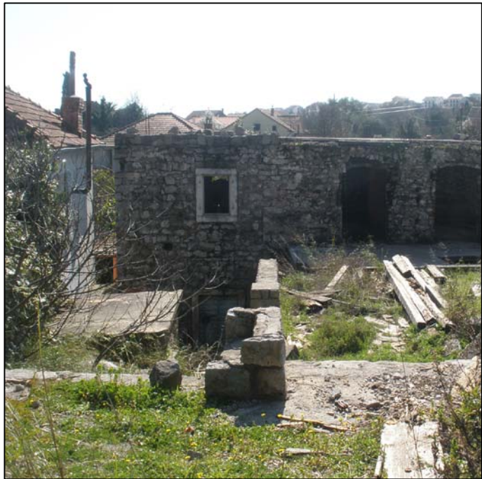
Foto - postojeće stanje, sjeverna fasada