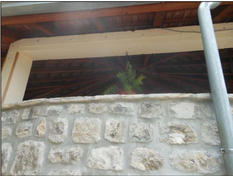
foto: objekat 4/ postojeći krovni pokrivač nad gumnom predviđen za uklanjanje