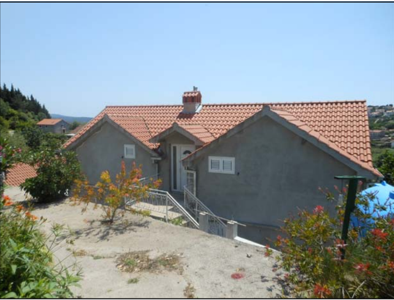
foto: objekat 1, sjeverna fasada