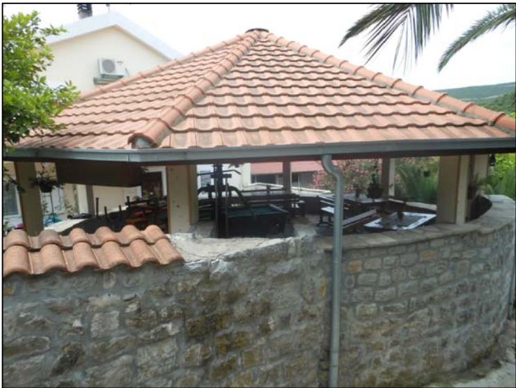
foto: objekat 4/ postojeći krovni pokrivač nad gumnom predviđen za uklanjanje