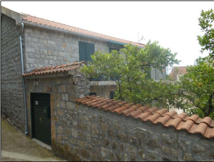
foto: objekat 2/ post. stanje