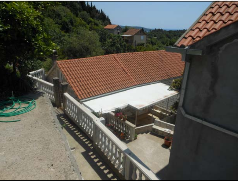
foto: objekat 2