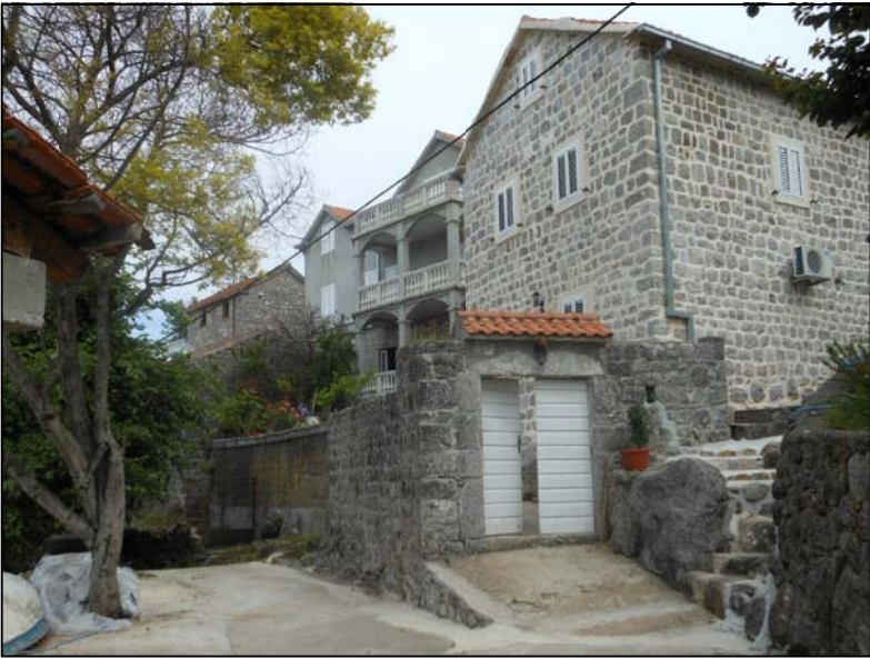
foto: pogled sa južne strane