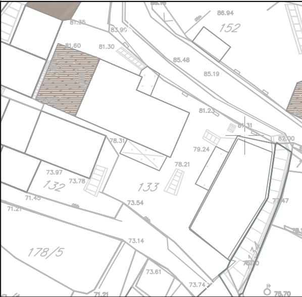
IZVOD IZ KATASTRA R=1:500