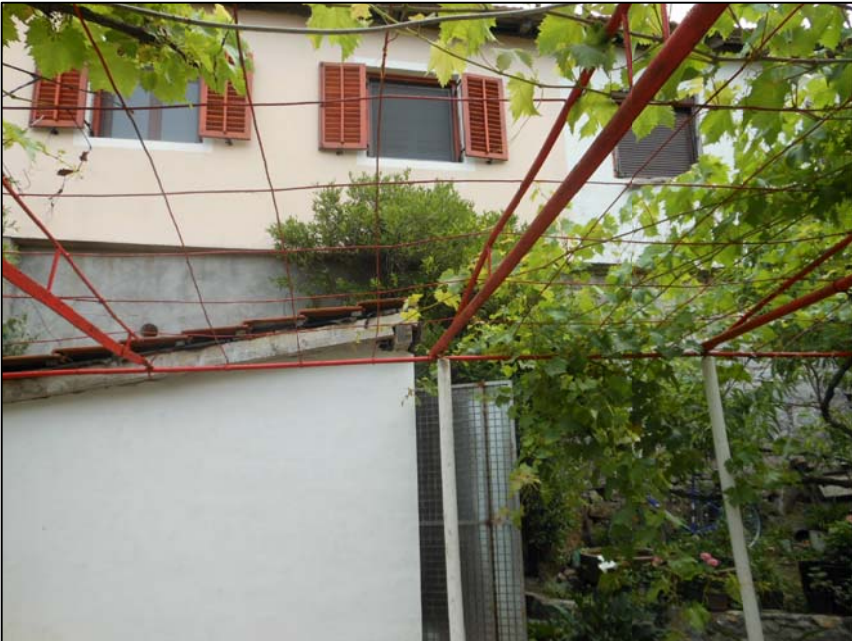
foto: segment južne fasade/ post. stanje