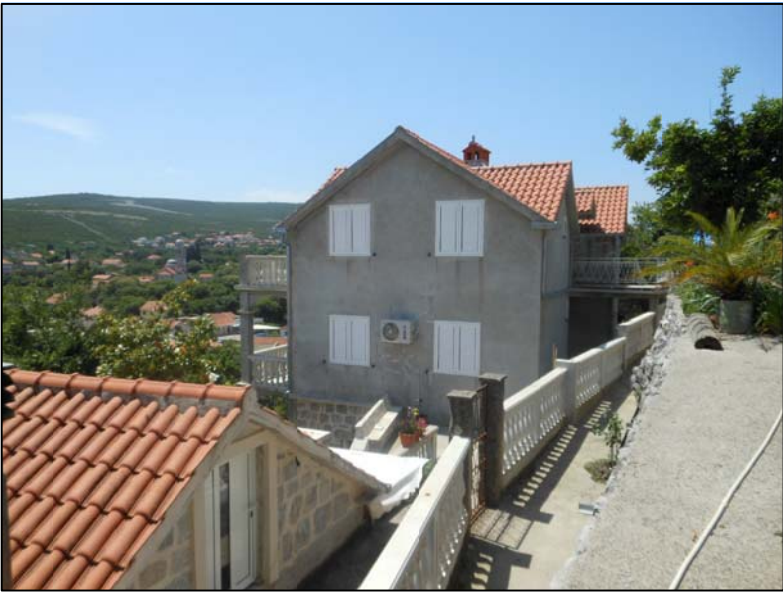
foto: objekat 2, objekat 1