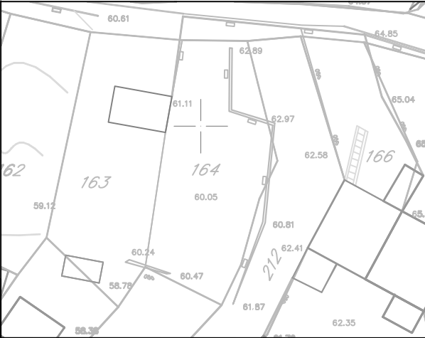
IZVOD IZ KATASTRA R=1:500