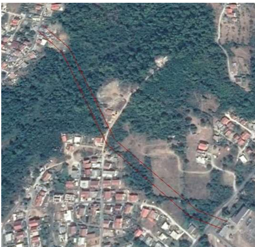
Slika 2. Lokacija trase dalekovoda i njene uže okoline (između crvenih linija)

U morfološkom pogledu šire područje lokacije odlikuje se izrazitim, lako uočljivim strukturnim elementima, antropogeno izmijenjene-urbanizovane teritorije, a u njegovom pejzažu uočava se kontrast mora, ravnice i u dubokom zaleđu uzvišenja.