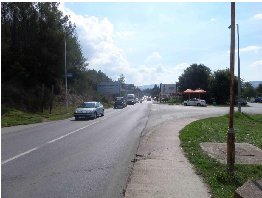
Slika 4. Početak dijela trase koji vodi pored Jadranske magistrale