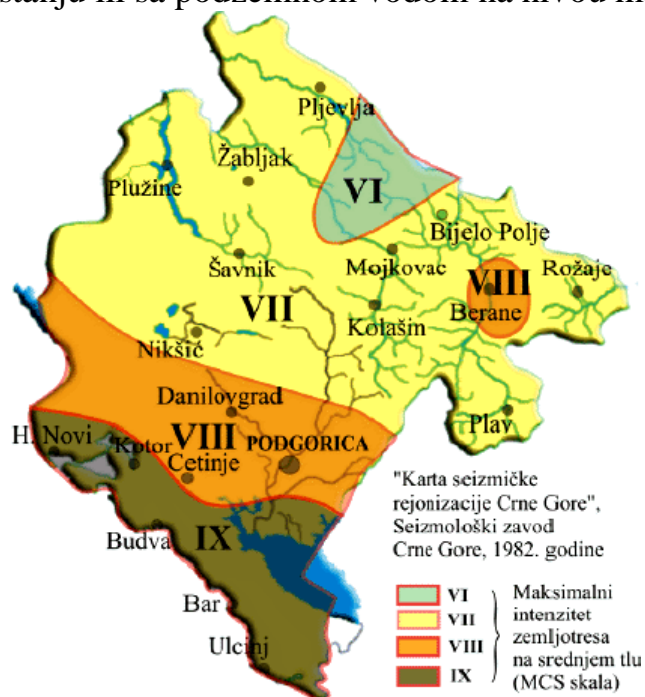
Slika 10. Karta seizmičke rejonizacije Crne Gore

Na osnovu karte seizmičke rejonizacije urbano područje Tivta pripada zoni sa osnovnim stepenom seizmičkog intenziteta 9^0 MCS, u uslovima srednjeg tla. Istražni prostor je izgrađen velikim dijelom od flišnih, pretežno klastičnih sedimenata i kvartarnih tvorevina što predstavlja veliki seizmički rizik, što je posebno značajno za urbana područja formiranim uglavnom na aluvijalnom tlu u vodozasićenom stanju ili sa podzemnom vodom na nivou manjem od 5 m.