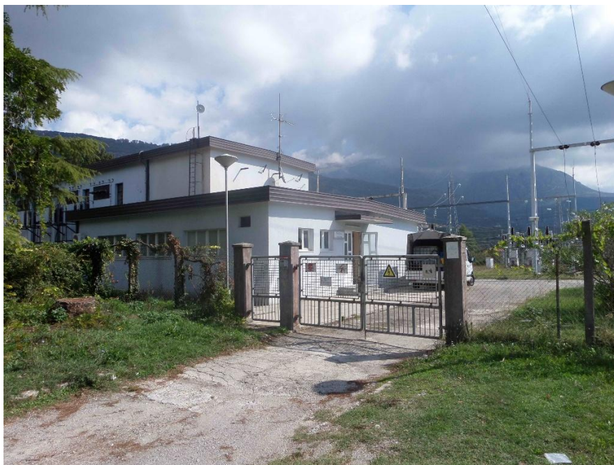
Slika 1. Trafostanica „Gradiošnica”

Polazna tačka predmetne dionice kablovskog voda i optičkog kabla je trafostanica 110/35/10 kV „Gradiošnica“ (Slika 1).