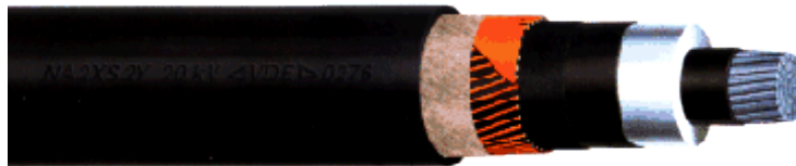
Slika 11. Izgled kabla

Jednožilni energetski kabl izolovan umreženim polietilenom i plastiran PE-masom, prema DIN VDE 276-620 nazivnog napona 20/35 kV.