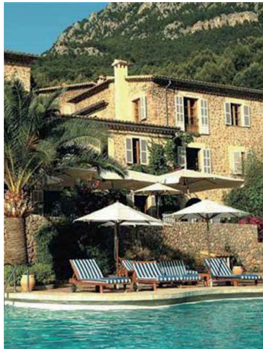
Bazeni između pripadajućih vila