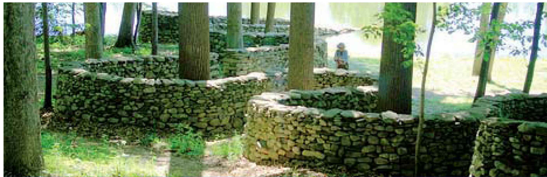
Zaštitni zidovi drveća