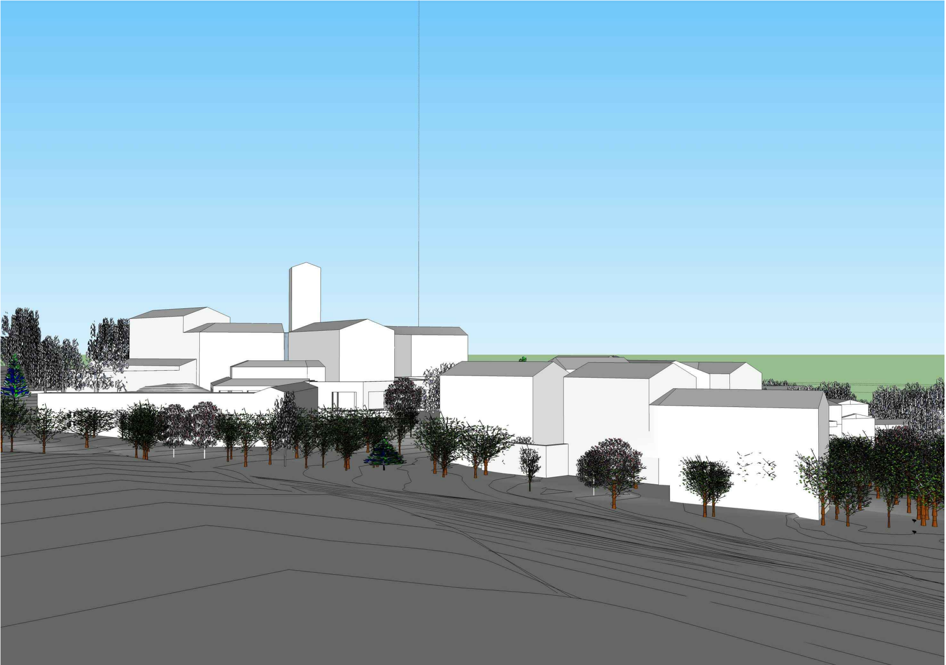
Pogled sa pristupnog puta