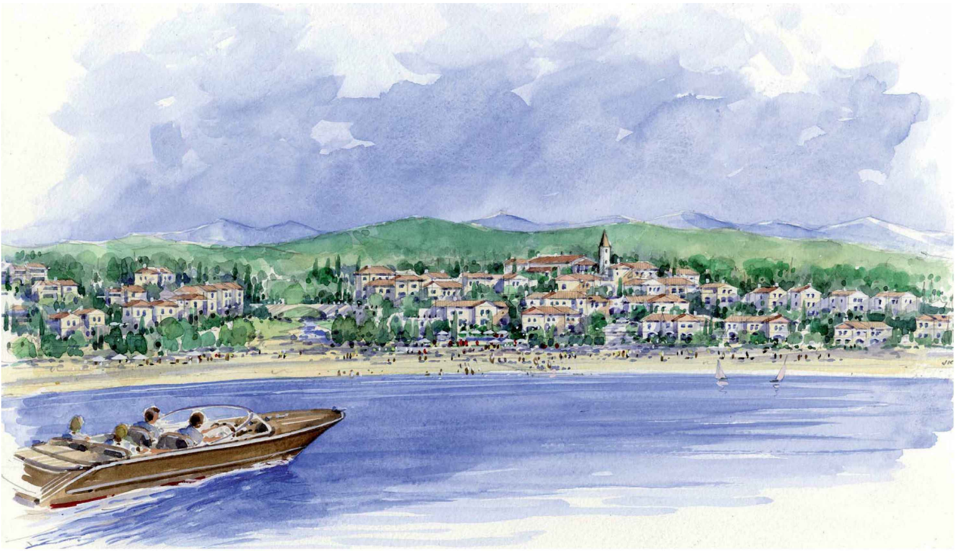
Pogled sa mora