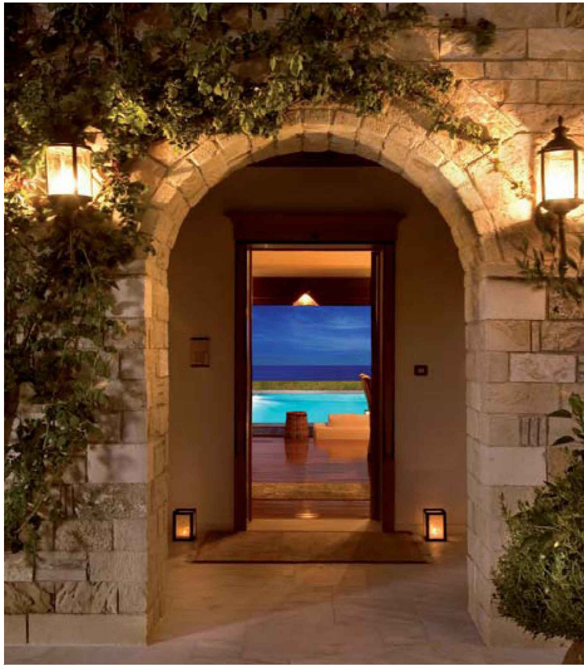
Primjer materijalizacije pripadajuće vile