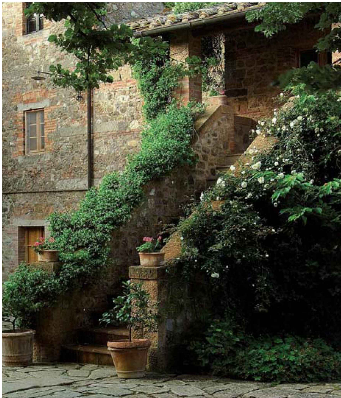
Primjer ulaza u pripadajuće vile