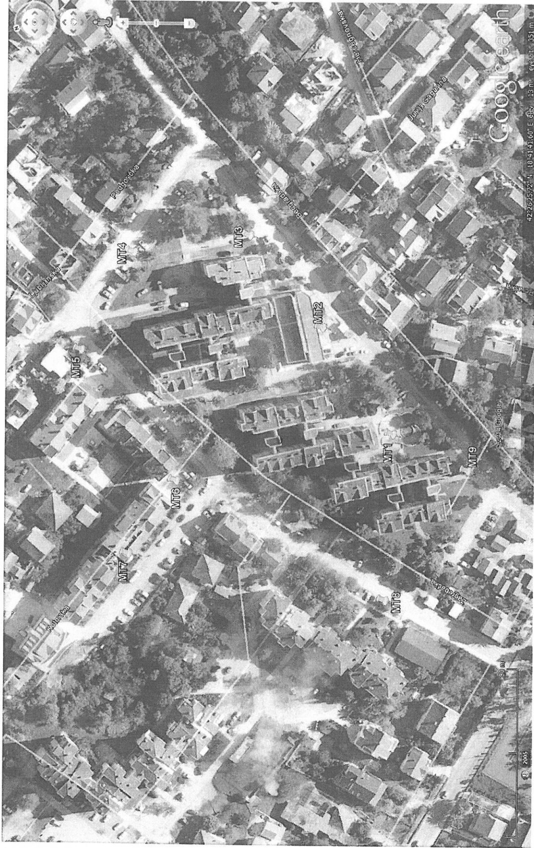
Prilog 1 Izvještaja o ispitivanju nivoa električnog polja broj 02/1-1205-3/2 od 11.07.2014. god.