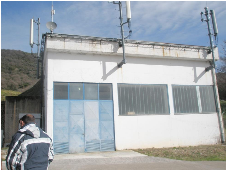
Slika 1. Izgled lokacije

Shodno Glavnom projektu RBS lokacije "KO09 Seljanovo", br. 181 CG/Rev 0, Društva za telekomunikacije MTEL d.o.o., postavljanje radio-bazne stanice "KO09 Seljanovo" je planirana na lokaciji Seljanovo, koja se nalazi u opštini Kotor. Na Sl. 1 je prikazan izgled lokacije na kojoj se planira postavljanje radio-bazne stanice "KO09 Seljanovo", dok je mapa lokacije prikazana na Sl. 2.