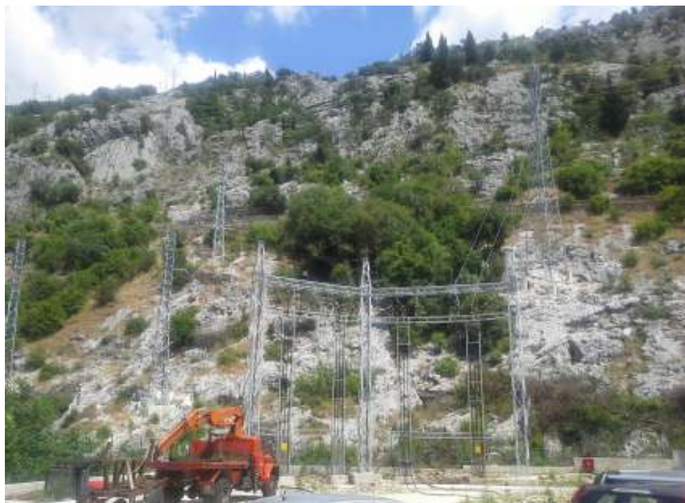
Karakteristični izgled terena na dijelu trase

Takođe, na ovoj lokaciji ne postoje objekti koji treba da se zadrže kao revitalizovano naslijeđe istorijske, industrijske ili druge arhitekture. Sama lokacija ne predstavlja značajan i prepoznatljiv prostor u odnosu na okruženje.