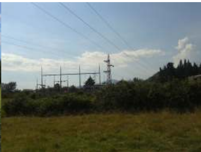
Detalj sa trase budućeg dalekovoda