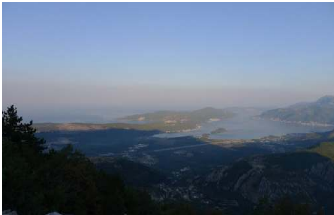
Detalj sa predmetnog područja

S obzirom na vrstu predmetnog projekta, prilikom njegovog izvođenja ima prije svega korišćenja zemljišta u određenim količinama ali ne i velike eksploatacije vrijednih prirodnih resursa.