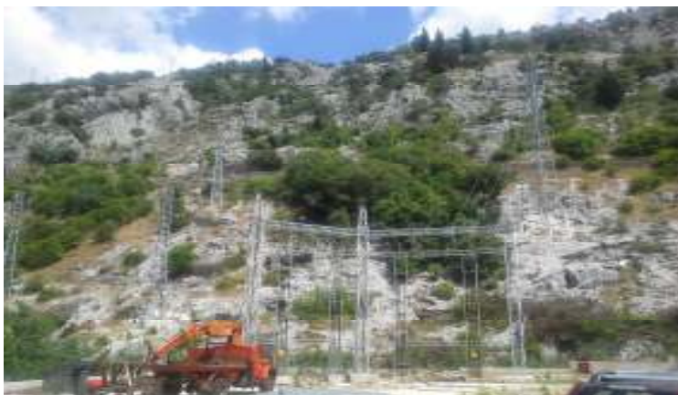
Detalj sa trase budućeg dalekovoda

Napomena: U dokumentaciji u dijelu priloga dostavljeno je pomenuto rješenje o u.t. uslovima.