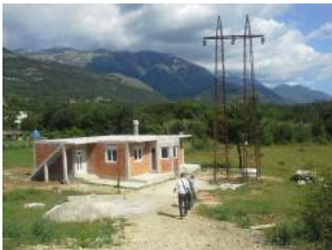
Objekat u izgradnji u blizini stuba dalekovoda

TS 110/35kV Kotor (Škaljari) je energetska objekat smješten na ivici naselja Škaljari. Trasa podzemnog kanala se pruža ispod starog puta Kotor-Cetinje i pristupnog puta van naselja „Škaljari”. S obzirom da se kraj njega nalaze već izgrađeni energetska objekti (DV 35 kV), zbog čijeg položaja nije moguće dovesti dalekovod nadzemnim putem do portala, jedino preostalo rješenje je uvođenje kablova podzemnim putem u transformatorsku stanicu.