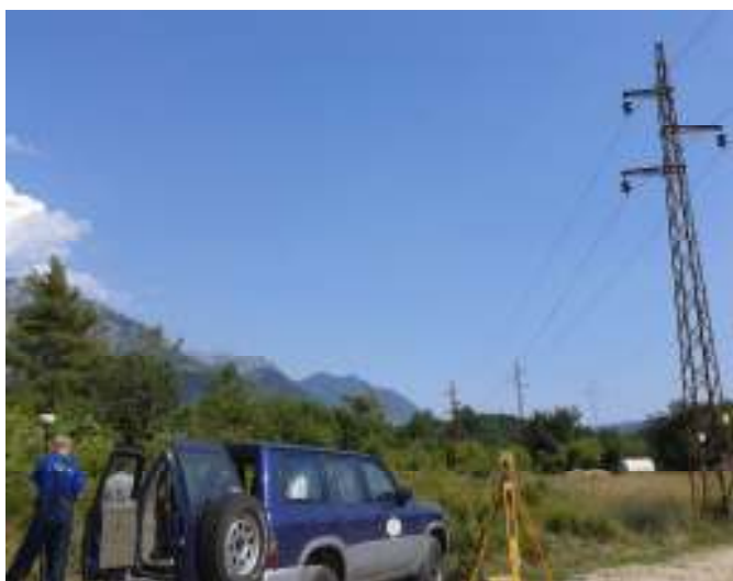
Detalj iz okoline