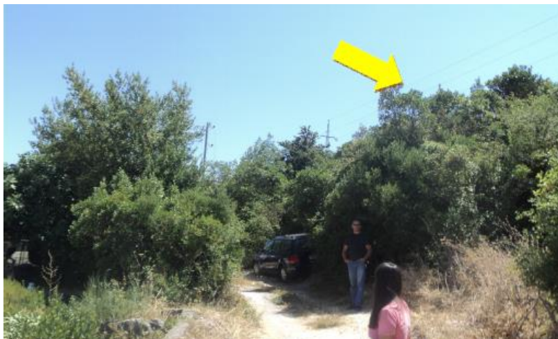
Slika 1. Izgled planirane lokacije

Na lokaciji „KO21 Krašići“ planirano je postavljanje telekomunikacione opreme GSM mreže preduzeća MTEL u Crnoj Gori kako bi se obezbijedilo kvalitetno pokrivanje signalom dijela teritorije opštine Tivat. U blizini lokacije se ne nalaze riječni tokovi kao ni izvorišta koja bi se koristila za vodosnabdijevanje. Na planiranoj lokaciji se ne nalaze zaštićene biljne i životinjske vrste kao ni njihova staništa. Planirana lokacija se nalazi iznad naseljene zone, na uzvišenju koje je trenutno obraslo šibljem, niskim i visokim rastinjem. Najbliži stambeni objekti se nalaza na rastojanju od oko 20m od planirane lokacije. Takođe, imajući u vidu planiranu lokaciju bazne stanice kao i njeno šire okruženje, konstatuje se da se ne nalaze zaštićeni objekti i dobra kulturno-istorijske baštine i ista nije predviđena za naučna istraživanja i ne nalazi se u blizini osjetljivih područja ili područja posebne namjene.