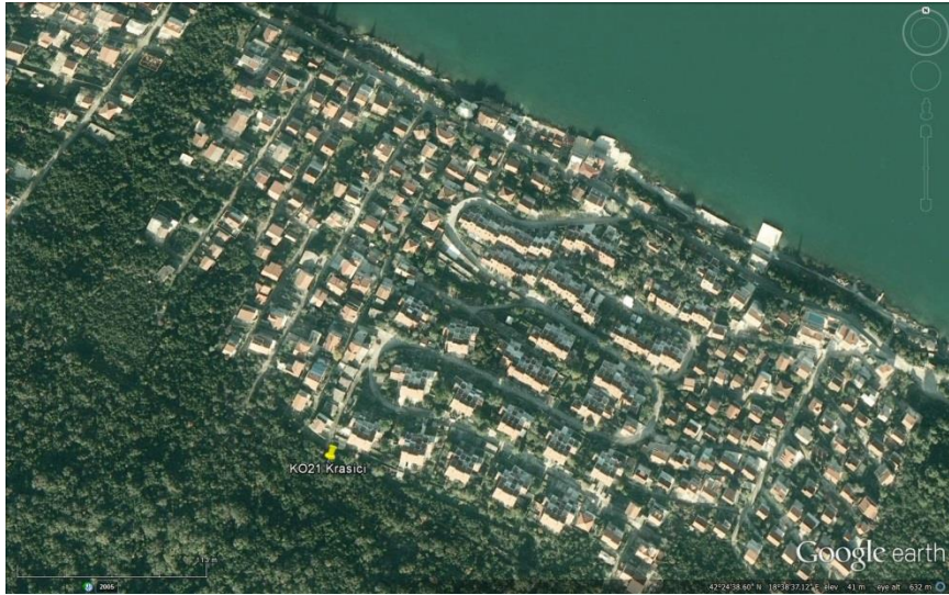
Slika 3. Mapa lokacije “KO21 Krašići”