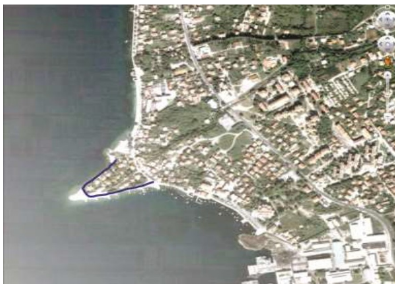
Slika 1. Satelitski snimak obale rt "Ponta Seljanovo"

Na rtu koji ovičava predmetni projekat, između južnog i sjevernog dijela obale, se nalaze individualni stambeni objekti.