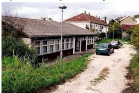
objekat škole od 1980 – 2008.g.

Od svog osnivanja do 2012 godine, škola je radila u neadekvatnim uslovima, kao “podstanar” u Radničkom domu i prizemlju bivše zgrade opštine Tivat, preko montažne barake u kojoj je smještena od zemljotresa 1979 godine, sa nedovoljnim brojem muzičkih instrumenata.