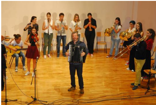
(seminar “Muzika kao sredstvo izražavanja”-