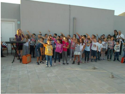
snaga su različiti projekti sa najmlađima