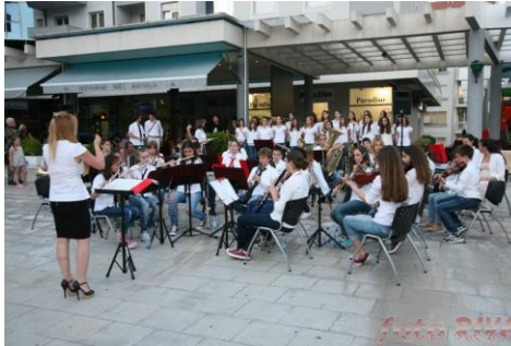
(svjetski Dan muzike – Trg Magnolija Tivat)