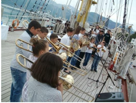
(nastup na školskom brodu Jadran)