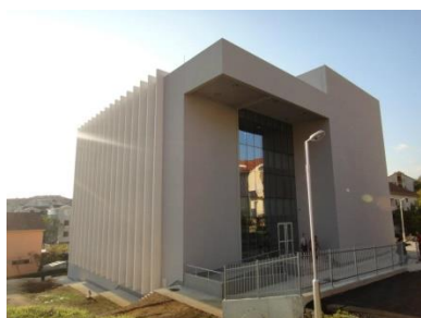
školski objekat od 2011.g.

Škola je sa radom u novom objektu započela šk: 2012/13.g.