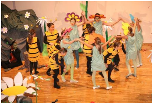
”dječji Mjuzikl” Svoj djeci što muziku vole vrata su otvorena od Muzičke škole”....

Snaga su veliki i mali hor, i duvački orkestar škole.