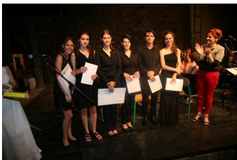
( prva generacija maturanata)