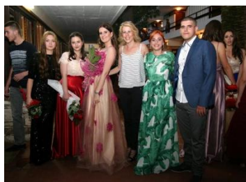
Matursko veče 2017.g.