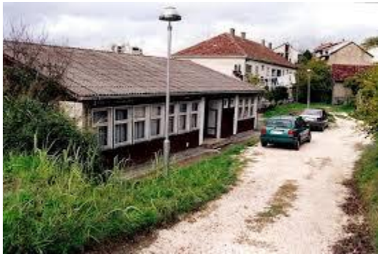
Škola od 1980 – 2008.g.

Školski objekat spada u veoma dobro opremljene i osposobljene objekte, za savremen način školovanja. Škola ima kako adekvatan prilaz tako i lift, što omogućava komunikaciju i osobama sa posebnim potrebama.