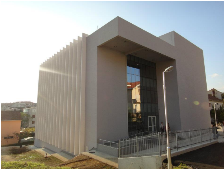
Školski objekat od 2011.g.