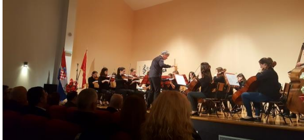
orkestar UMŠ „ Luka Sorkočević Dubrovnik